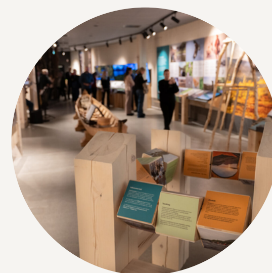
UTSTILLINGEN "FANTASTISKE REISA"