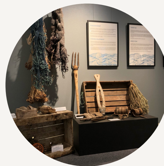
UTSTILLINGEN "MASKEBETT OG NÅL"