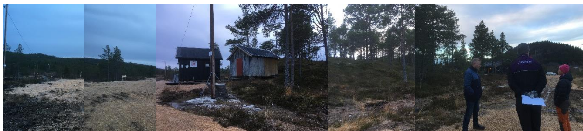
Bildet viser område for skileik, og med start for løype/turløype til venstre og hytta Haraldstu kan skimtes til høyre.