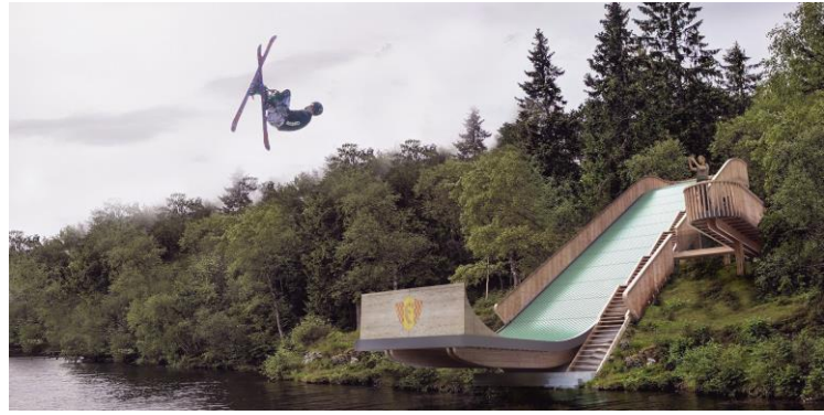
Fotomontasje: Rallar Arkitekter

Bildene viser vannhoppet ved Kyvannet, som fotomontasje og under bygging.