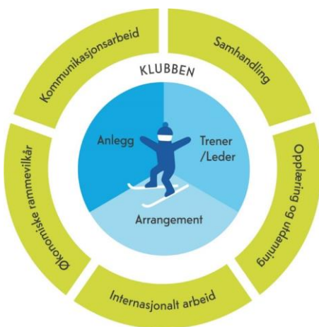
Figur 1) Utøveren i sentrum

Menneske utviklar seg i ulik takt, uavhengig av alder og ferdigheitsnivå. Skiidretten sine framtidige mål er difor tilrettelagt for idrettsleg utvikling basert på utviklingsalder framfor kronologisk alder. Samtidig vil skiidretten vere eit betydeleg bidrag i eit folkehelseperspektiv. Gjennom auka skiutøving og skiglede vert det lagt til rette for at ski blir ein integrert del av folk sin kvardag. Gjennom utviklingsbasert tilrettelegging skal Norges Skiforbund stadfeste sin posisjon som verdas beste skinasjon, og at vi er ein nasjon beståande av skiløparar.