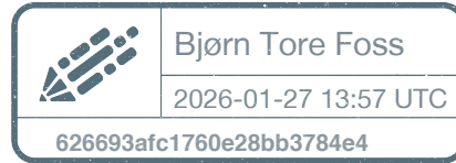
Bjørn Tore Foss