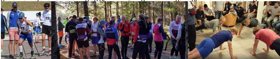
Fra rulleskisprint i Holmenkollen i September. Langtur og push-ups konkurranse på Gjøvik i Oktober

Hoveddelen av treningen for løperne i TK foregår i klubbene. TK bidrar med gode treningsarenaer, kompetansebygging, lagbygging og med å utnytte felles ressurser. Tilbudet har bestått av tre nærsamlinger, tre fjernsamlinger, reise, opphold, smøring og sekundering på norgescup og junior-NM. Trenerne og sportslig leder har hatt mange og gode diskusjoner om trening og gjennomføring av samlingene gjennom siste sesong.