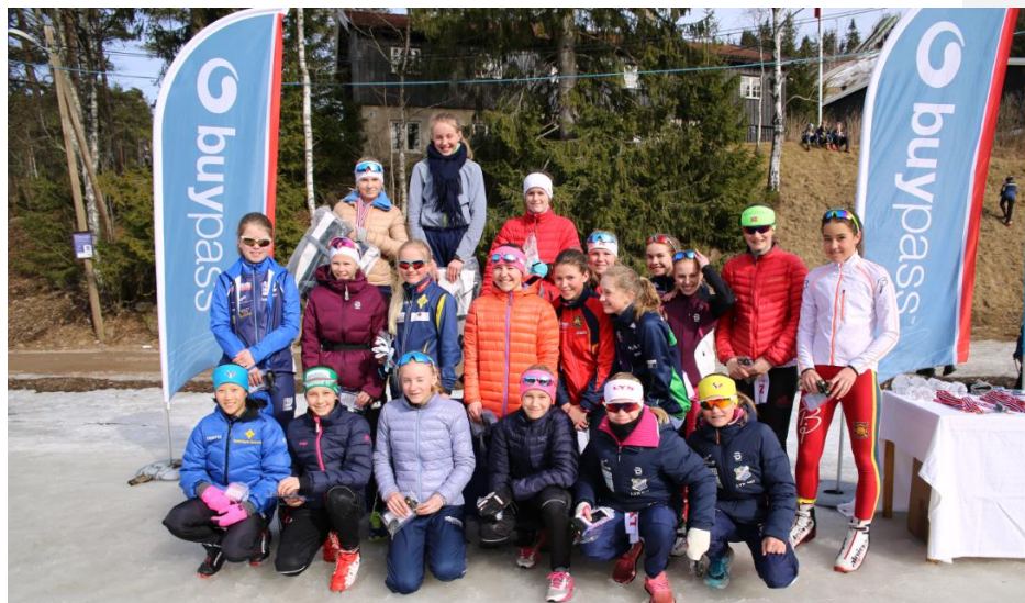
Fornøyde 14-åringer som har fullført Buypass Cup.