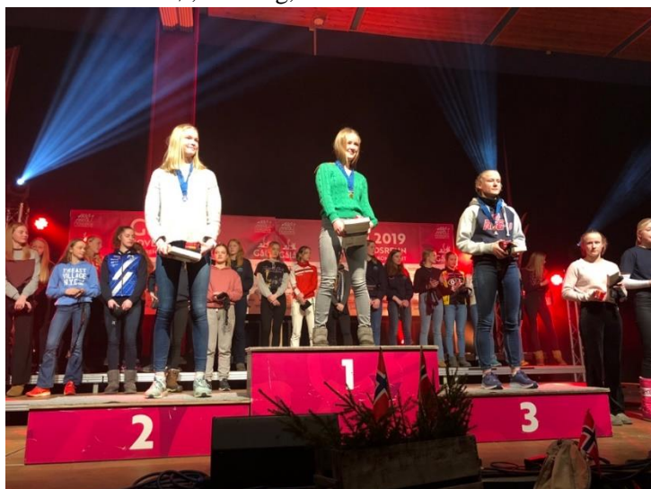
En svært fornøyd vinner av sprint J15 på toppen av pallen.