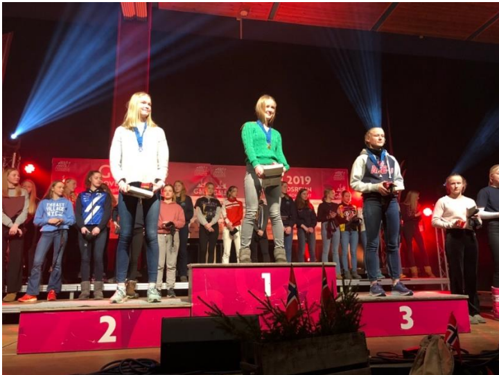
En svært fornøyd vinner av sprint J15 på toppen av pallen.