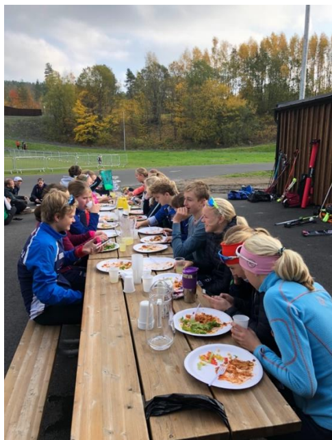
Skikkelig kost er viktig for å prestere på samling.

Alle deltakere var veldig fornøyd med samlingen, og de fleste skulle ønske at den hadde vart enda lenger. Så det er en tilbakemelding vi tar med oss inn i neste sesong hvor det nok legges på en økt til etter lunsj.