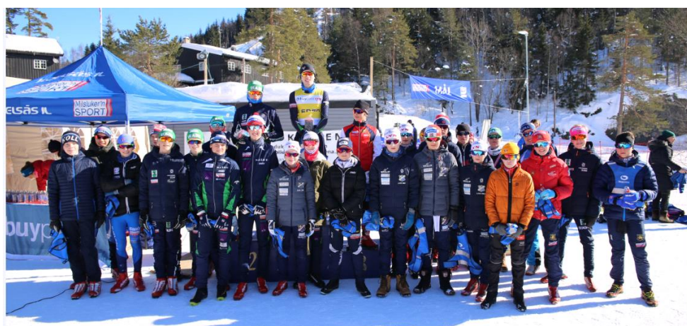
Gutter 2004, siste sesong med cup kun i Oslo gjennomført!