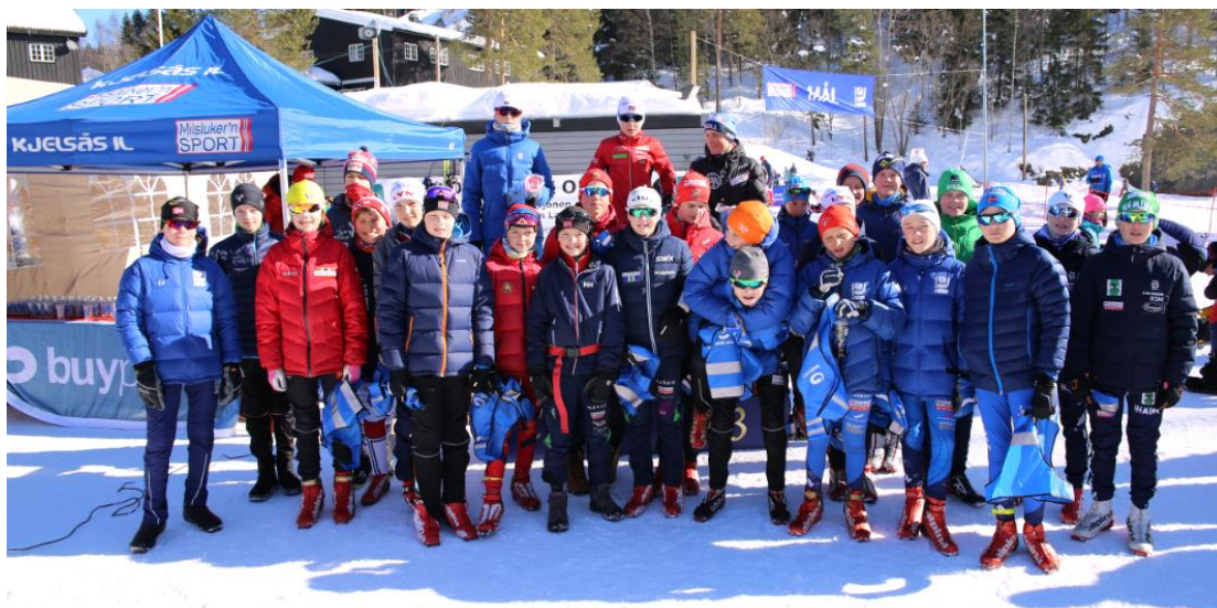
Fornøyde 13-åringar som har fullført Buypass Cup 2018

Deltakerne fikk buy-pass pannebånd ved målgang i første renn i Buypass cup. De tre beste i hver klasse fikk en trådløs høyttaler, og alle som fullførte fikk deltakerpremie. Premieutdelingen ble gjennomført i forbindelse med Martincrossen.