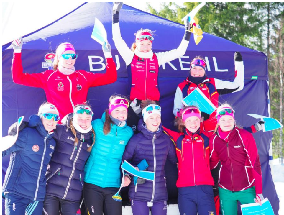
En glad top-10 J15-gjeng som alle fikk et adgangskort til SNØ i premie.