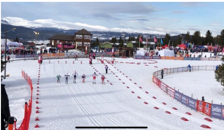
Skianlegget på Gålå er stort og profesjonelt, her fra sprinten på Gålå Skistadion.