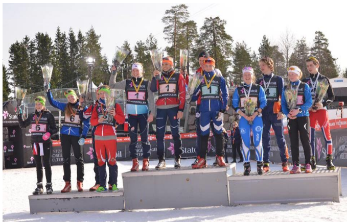
Seierspallen i Ungdomsstafetten 2014. På det høyeste trinnet ser vi vinnerne fra Buskerud, til venstre for dem i bildet har vi Oppland som ble nummer 2, mens 3. plass gikk til Akershus.