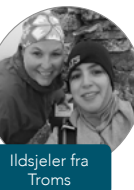
Ildsjeler fra Troms