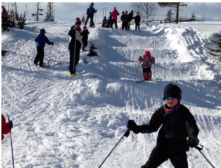
SKISSE: EKSEMPEL HENTET FRA SKIFORBUNDETS NETTSIDE