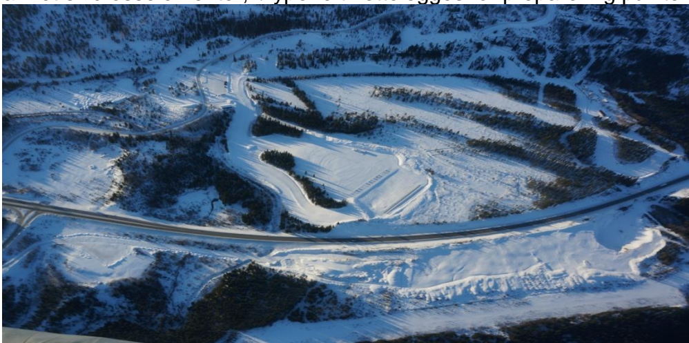
Foto: Snåsa skiskytterlag - Bjørgan skianlegg, Grong Sparebank skistadion