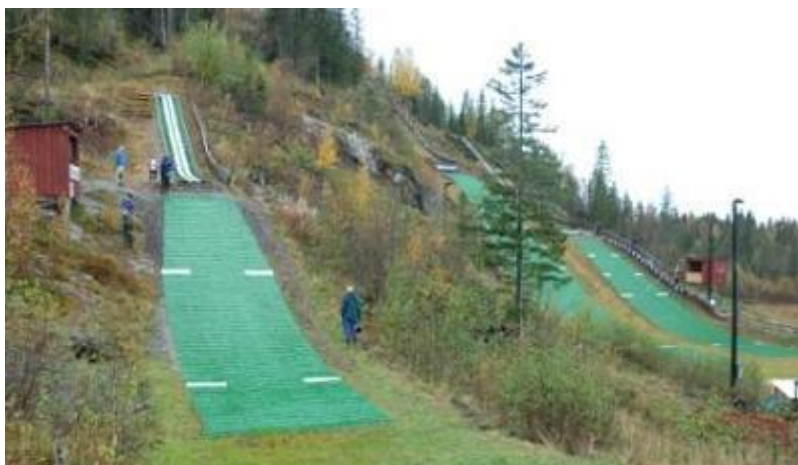
SKATVAL SKILAG, KLEMPEN SKISENTER K10, K35 OG K20