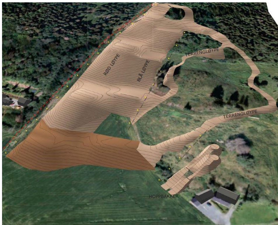
SKISSE: IDERØY IL, PRESTLIA AKTIVITETSPARK - MODELL AV FRAMTIDIG ANLEGG