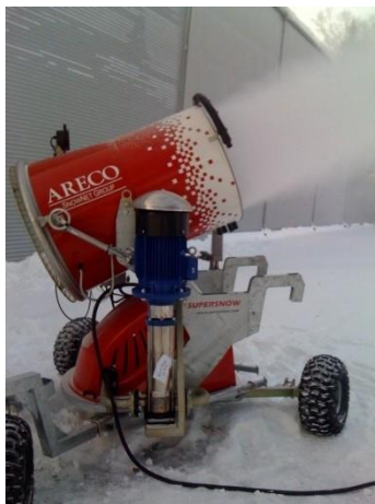
SKISSE: FOTO: HANS PETTER KROGSTAD – SKOEN IL'S NYE SNØKANON