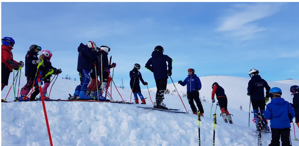
Fartstrening på Grong like før koronaen satte inn. Besøk av trenere og løpere fra Mo i Rana.

Alpinkomiteen hadde planlagt et prosjekt som skulle bringe alpinsporten inn i nye bakker, og styrke rekrutteringen av løpere og trenere. Dette skulle foregå i Børgefjell, Lierne, Torsbustaden og Bråten. Dette ble avlyst på grunn av koronaen.