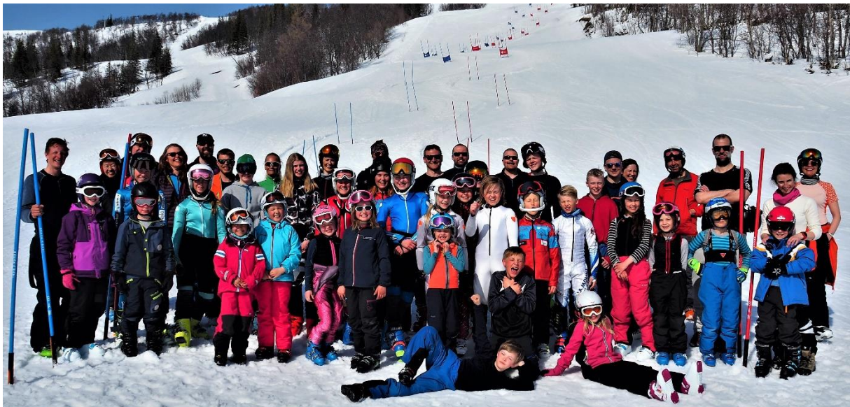
Rekrutteringssamling og sesongavslutning på Storlien 2017/2018!

Sesongene 2017/2018 og 2018/2019 har alpinsporten hatt økt interesse. AK har fortsatt å arrangere åpne kretssamlinger for løpere fra 8 år, både barmark og snøsamlinger. Snøsamlingene har fungert godt som rekrutteringsarena. Vi har hatt fem samlinger pr sesong på snø, som oftest i Grong, Meråker eller Storlien alt etter snøforhold og geografisk variasjon.