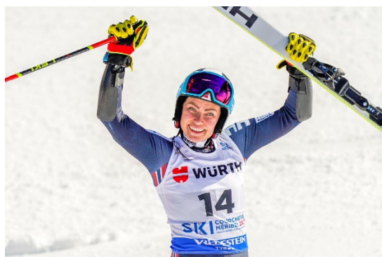
Ragnhild Mowinckel, VM Bronse 2023