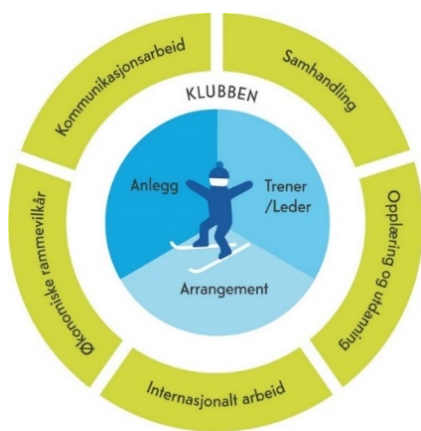
Figur 1) Utøveren i sentrum

Utvikling av skiutøveren skal gjøres i et langsiktig utviklingsperspektiv. Derfor er det utøveren som er i sentrum for skiidrettens mål. For at en utøver skal kunne utvikle seg er det behov for trenere, arrangement og anlegg som er tilrettelagt på en slik måte at utvikling skjer gjennom et langt idrettsliv. Til sammen utgjør elementene nærmest utøveren kjernevirksomheten for all virksomhet, fra skiklubb, via skikrets og til skiforbundet. Mennesker utvikler seg i forskjellig takt, uavhengig av alder og ferdighetsnivå. Skiidrettens fremtidige mål er derfor tilrettelagt for idrettslig utvikling basert på utviklingsalder fremfor kronologisk alder. Samtidig vil skiidretten være et betydelig bidrag i et folkehelseperspektiv. Gjennom økt skiutøvelsen og skiglede legges det til rette for at ski blir en integrert del av folks hverdag. Gjennom utviklingsbasert tilrettelegging skal Norges Skiforbund befeste sin posisjon som verdens beste skinsjon, og at vi er en nasjon bestående av skiløpere.