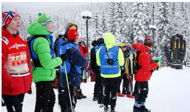
Langrennstrenere på plass ringside under NM på Ski.