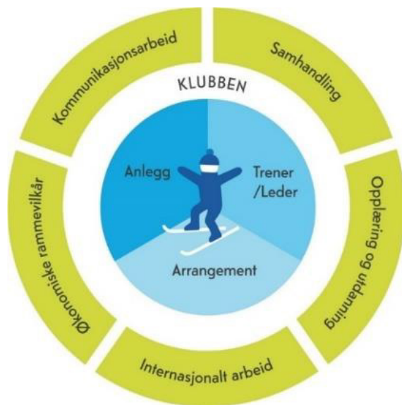
Utøveren i sentrum

I tråd med SUM skal utvikling av langrennsutøveren gjøres i et langsiktig perspektiv. Derfor er det utøveren som er i sentrum for skiidrettens mål. For at en utøver skal kunne utvikle seg er det behov for trenere, arrangement og anlegg som er lagt til rette på en slik måte at utvikling skjer gjennom et langt idrettsliv. Til sammen utgjør elementene nærmest utøveren vår kjernevirksomhet, fra skiklubb, via skikrets og til Skiforbundet. Gjennom en utviklingsbasert tilrettelegging skal Norges Skiforbund Langrenn befeste sin posisjon som verdens beste langrennsnasjon, og at vi er en nasjon bestående av skiløpere.