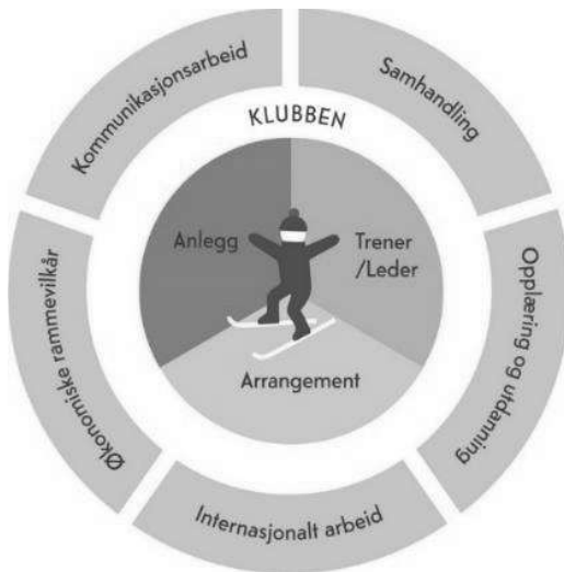
Fig. nr. 1) Utøveren i sentrum