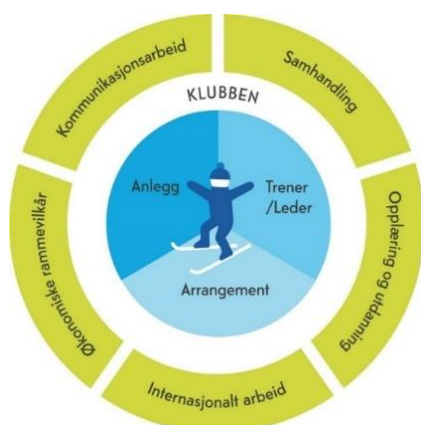
Figur 1) Utøveren i sentrum

Utvikling av skiutøveren skal gjøres i et langsiktig perspektiv. Derfor er det utøveren som er i sentrum for skiidrettens mål. For at en utøver skal kunne utvikle seg er det behov for trenere, arrangement og anlegg som er tilrettelagt på en slik måte at utvikling skjer gjennom et langt idrettsliv. Til sammen utgjør elementene nærmest utøveren kjernevirksomheten for all vår virksomhet, fra skiklubb, via skikrets og til Skiforbundet. Mennesker utvikler seg i forskjellig takt, uavhengig av alder og ferdighetsnivå. Skiidrettens fremtidige mål er derfor tilrettelagt for idrettslig utvikling basert på utviklingsalder og erfaring fremfor faktisk alder. Alle skiidrett over hele landet gir et betydelig positivt bidrag til folkehelsen – et bidrag som skal forsterkes fremover. Med økt skiutøvelse og mer skiglede hos alle blir skiidretten en enda mer integrert del av folks hverdag. Gjennom utviklingsbasert tilrettelegging skal Skiforbundet befeste sin posisjon som verdens beste skinasjon, og at vi er en nasjon bestående av skiløpere.