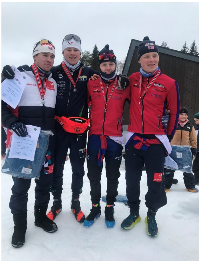
Stafettlaget som for andre år på rad vant sølv til Oslo under NM junior.

Sammenlagt i NC oppnår vi pall-plasser i klassene M17, K17, K18 og K19/20.