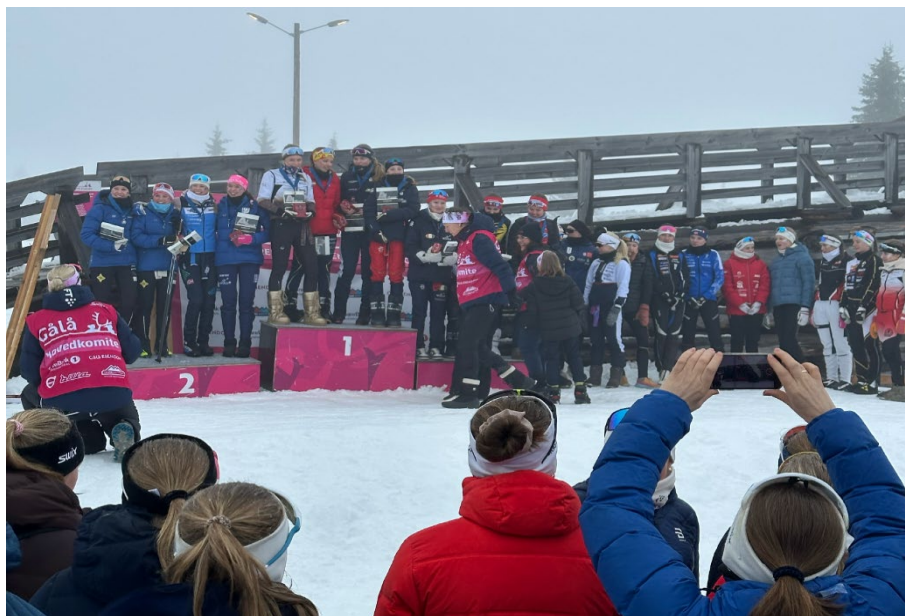
Premiering HL Gålå stafett jenter