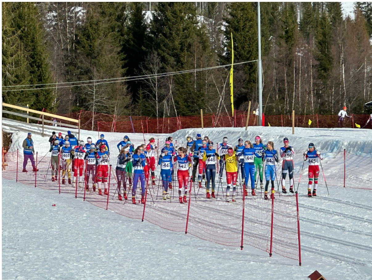
fra startstreken på Nordåsrennet.