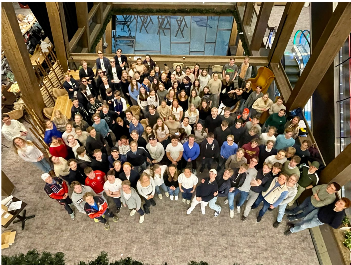
fra Toyota Langrennscup sesongavslutning på SNØ 7/4.