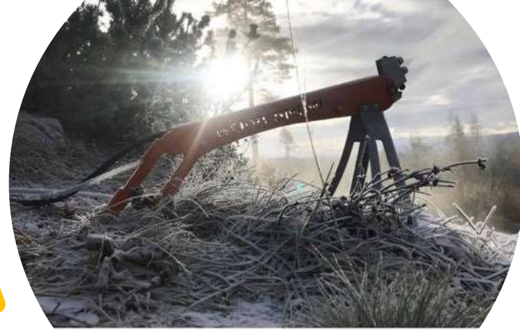
NON FOR HAGEN: Slik ser Happysnow-snøkanon nok snø til hageparken din på 12 timer. Fo'