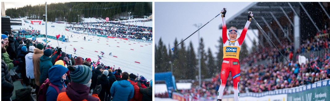
23.02.20: World Cup/ Ski Tour 2020.

Touren ble gjennomført 15.-23. februar 2020 med avslutning i Granåsen Skisenter. Nye langrennsløyper og helse- og arenabygg på langrennsstadion ble tatt i bruk for første gang ved arrangementet.