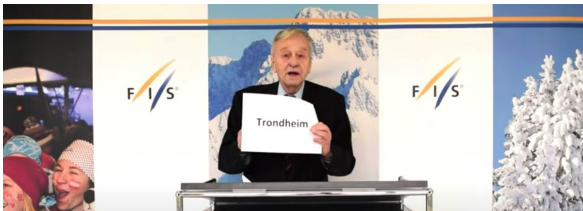
03.10.20: FIS-president Gian-Franco Kasper offentliggjør Trondheim som arrangør av VM på ski i nordiske grener 2025.

Seks år etter at VM-søknadsprosessen formelt startet og nesten ti år etter at Sør-Trøndelag Skikrets, sammen med skilmiljøet i Trøndelag, Trondheim kommune og støttespillere i hele Trøndelag begynte arbeidet med et nytt ski-VM, ble det endelig klart; Trondheim skal arrangere VM på ski i 2025!