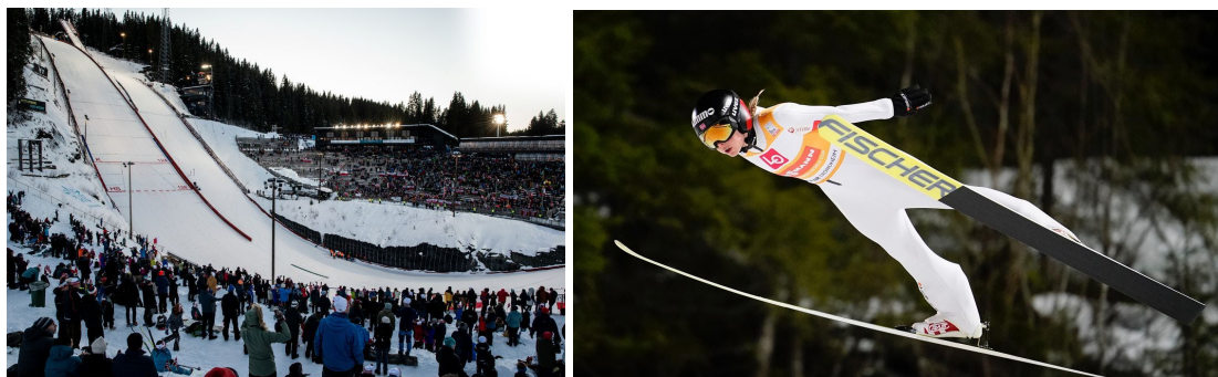
13.-14.03.19: World Cup/ Raw Air Granåsen. Maren Lundby vant kvinnenenes første Raw Air-turnering.

Trondheim er hvert år i mars vertskap for World Cup i hopp (Raw Air) og kombinert. Dette arrangementet er et utstillingsvindu for Trondheim som internasjonal arrangørby. VM-prosjektet har samarbeidet med World Cup først og fremst gjennom organisering av seminarer i Granåsen for økt oppmerksomhet samt formidling av kunnskap og informasjon. Ordfører i Trondheim har arrangert "ordførerseminar" der alle ordfører i Trøndelag samt andre sentrale personer fra det offentlige, idretten og kulturlivet har vært invitert.