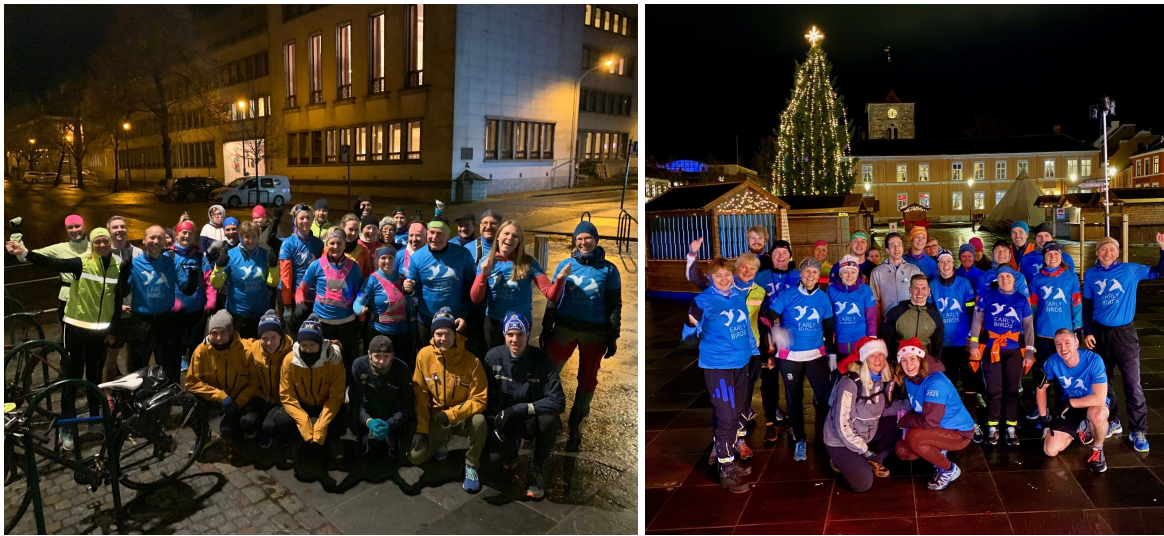
Høsten 2019: Early Birds i Trondheim - i november med elitegruppen i Trønderhopp som deltakere.

“Early Birds” er varemerkeregistrert i kategoriene trening, trim, folkehelse og eies av Trondheim kommune.