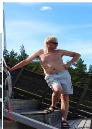
Tilbakemelding fra trener.