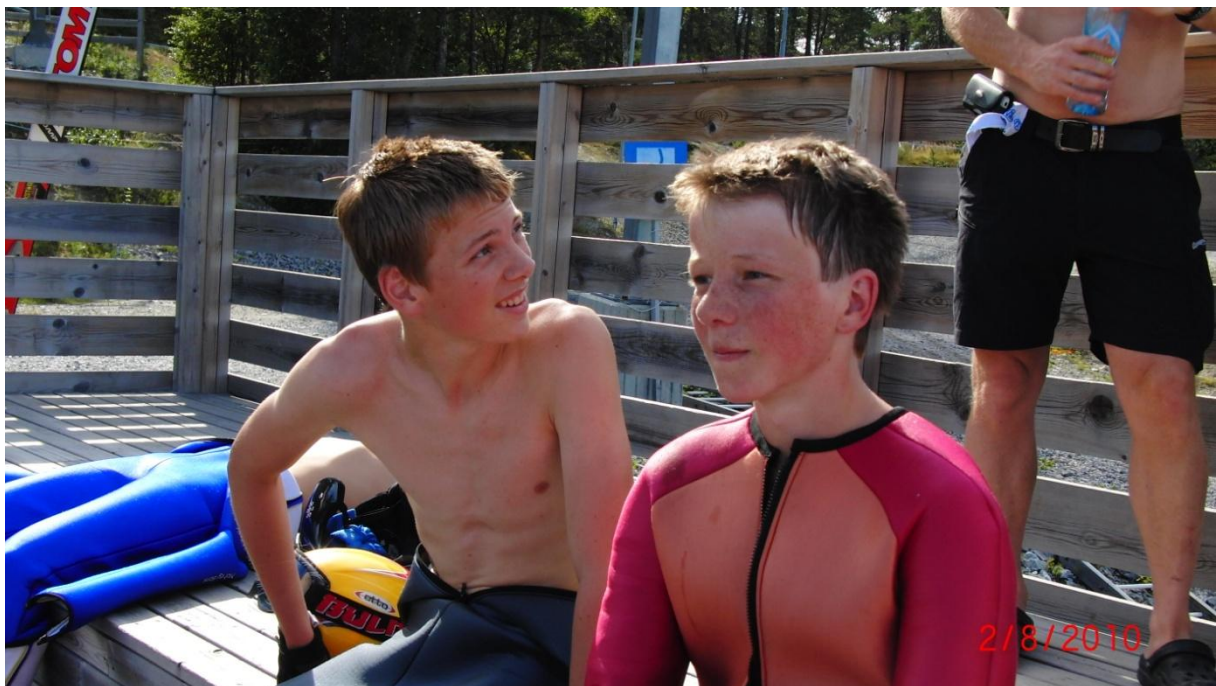
Alle får tilbakemelding av trener etter sitt hopp i K90, K55, K35, K20 eller K10

Alle ble med i de bakkene de selv følte de behersket å hoppe i, rennet startet i K90. Hoppet du i K90 måtte du også hoppe i de fire andre bakkene osv.